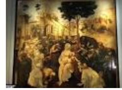
ADORAZIONE DEI MAGI – Leonardo da VINCI