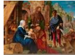
ADORAZIONE DEI MAGI – Albrecht Durer