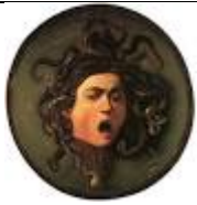
MEDUSA – Caravaggio