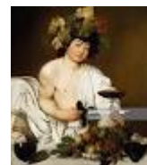
BACCO – Caravaggio