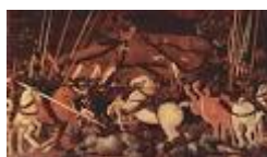
BATTAGLIA DI SAN ROMANO – Paolo Uccello