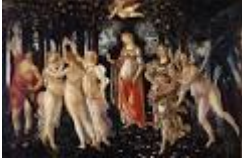
LA PRIMAVERA – Sandro Botticelli