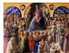
INCORONAZIONE DELLA VERGINE – Filippo Lippi