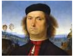
RITRATTO DI FRANCESCO DELLE OPERE – Perugino