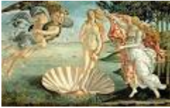
NASCITA DI VENERE – Sandro Botticelli