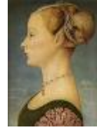
RITRATTO FEMMINILE – Piero del Pollaiuolo