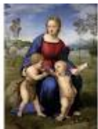
MADONNA DEL CARDELLINO – Raffaello Sanzio