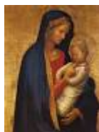
MADONNA DEL SOLLETICO – Masaccio