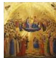
Incoronazione della VERGINE con angeli e santi – Beato Angelico