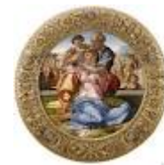
SACRA FAMIGLIA – Michelangelo Buonarroti