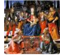
MADONNA IN TRONO COL BAMBINO – Ghirlandaio