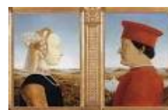
DITTICO DEI DUCHI DI URBINO – Piero Della Francesca