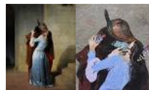
IL BACIO di F. Hayez