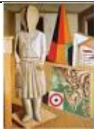
LA MUSA METAFISICA di C.: Carra'