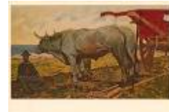
IL CARRO ROSSO di G. Fattori