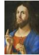
REDENTORE BENEDICENTE di A. Vivarini