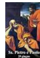
I SANTI PIETRO E PAOLO di G. Reni