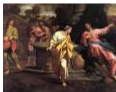
LA SAMARITANA AL POZZO di A. Carracci