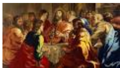
IL CENACOLO di P. P. Rubens