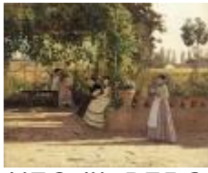
UN DOPORANZO (IL PERGOLATO) di S. Lega