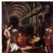
IL RITROVAMENTO DEL CORPO DI SAN MARCO del Tintoretto