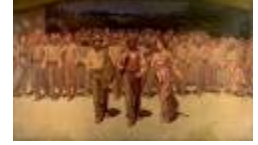
FIUMANA di G. Pellizza da Volpedo