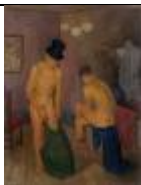
MODELLI NELLO STUDIO di M. Mafai

VOLETE UN CONSIGLIO? STAMPATE LA 1^ E LA 2^ PARTE DELLE OPERE CHE VI ABBIAMO EVIDENZIATO E, DURANTE LA VISITA, FATE UNA CROCE SULLE OPERE CHE AVRETE VISIONATO