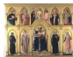
POLITTICO DI SAN LUCA di A. Mantegna