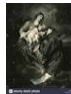
MADONNA COL BAMBINO E S. ANTONIO DA PADOVA di Van Dyck