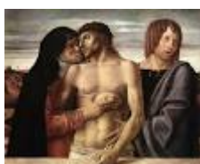
PIETA' di Giovanni Bellini