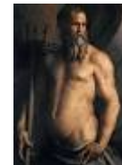
RITRATTO DI ANDREA DORIA COME NETTUNO del Bronzino