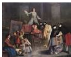
IL CAVADENTI di P. Longhi