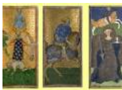
CARTE DA TAROCCHI di B. Bembo