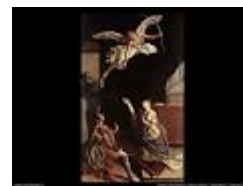
I MARTIRI VALERIANO, TIBURZIO E CECILIA di O. Gentileschi