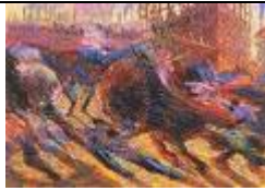
LA CITTA' CHE SALE di U. Boccioni