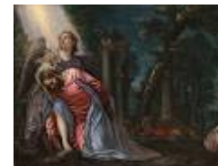
CRISTO NELL'ORTO DEL GETSEMANI del Veronese