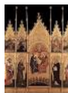
POLITTICO DI VALLE ROMITA di G. da Fabriano