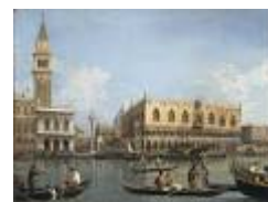
VEDUTA DEL BACINO DI SAN MARCO del Canaletto