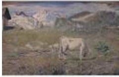
PASCOLI DI PRIMAVERA di G. Segantini