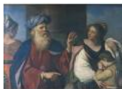
ABRAMO RIPUDIA AGAR del Guercino