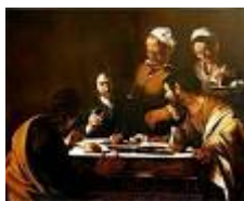
LA CENA IN EMMAUS del Caravaggio