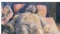
CRISTO MORTO di A. Mantegna

Le acquisizioni che hanno scandito la lunga storia di Brera ne fanno oggi una delle raccolte d'arte più importanti d'Italia e del mondo per ricchezza e qualità delle opere possedute, che spaziano dal tardo Medioevo al XX secolo, con capolavori quali la Pala Montefeltro di Piero della Francesca, Lo sposalizio della Vergine di Raffaello e il Cristo morto di Mantegna.